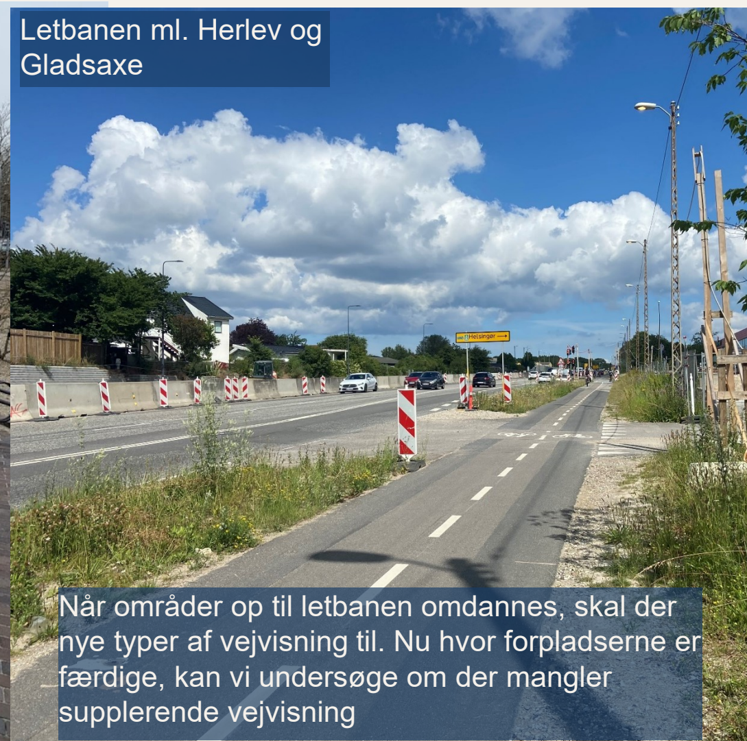
Letbanen ml. Herlev og Gladsaxe

Når områder op til letbanen omdannes, skal der nye typer af vejvisning til. Nu hvor forpladserne er færdige, kan vi undersøge om der mangler supplerende vejvisning