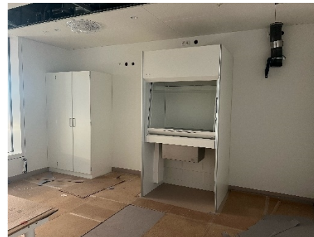
Der er monteret stinkskebe i KBA