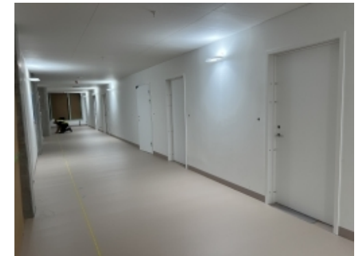
Test af belysningsarmaturer i KBA