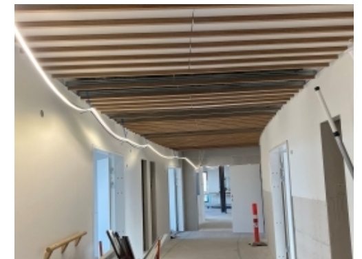
Lamel trælofter er igangsat i sengeslangen på etage 2.