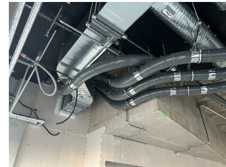
Montage af rørpostanlæg pågår