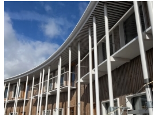
Der monteres værn ved sengestuebalkoner.