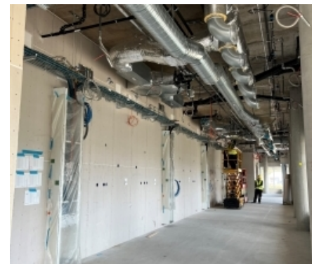
I dialysen monteres dialysepaneler