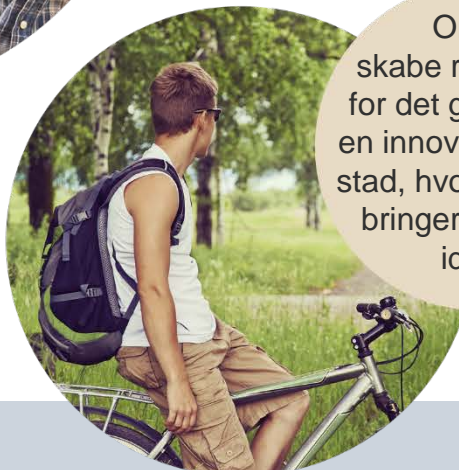
Om at skabe rammerne for det grønne liv i en innovativ hovedstad, hvor forskning bringer liv til nye idéer