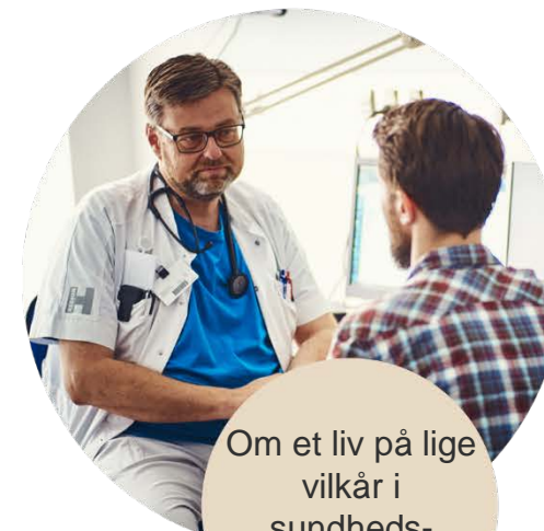
Om et liv på lige vilkår i sundhedsvæsenet