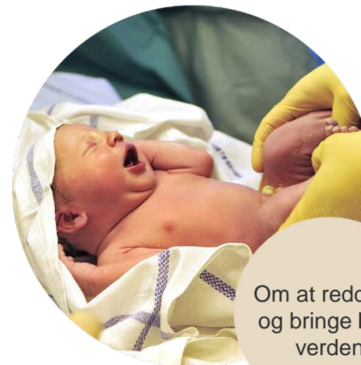
Om at redde liv og bringe liv til verden