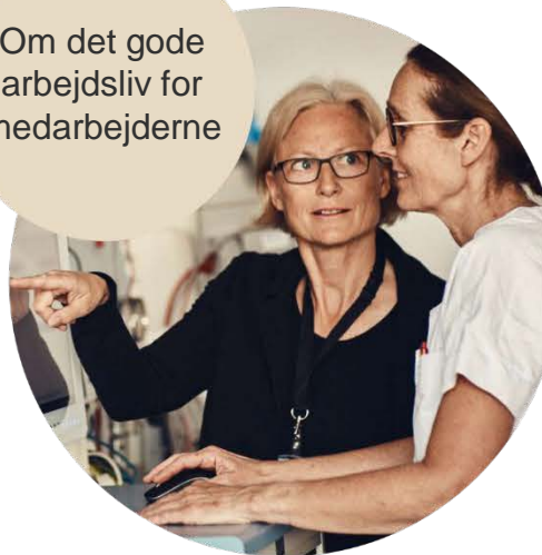
Om det gode arbejdsliv for medarbejderne