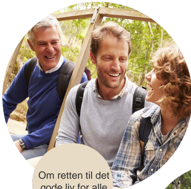
Om retten til det gode liv for alle