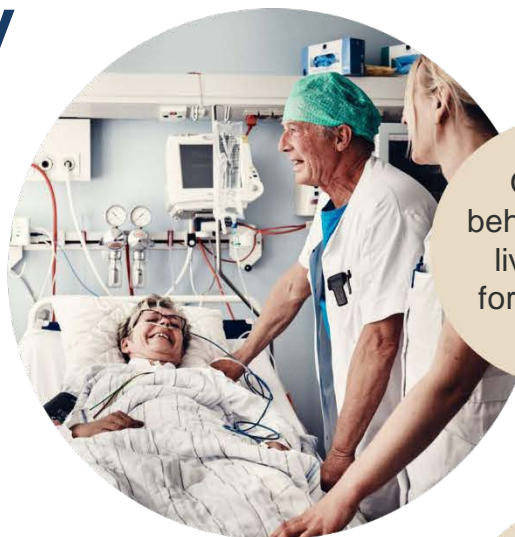
Om god behandling og livskvalitet for patienten