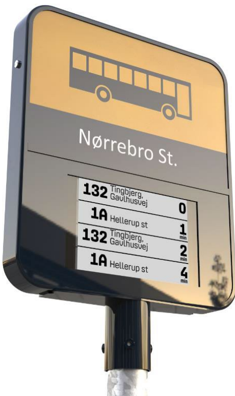
Figur 2: Rør-stander