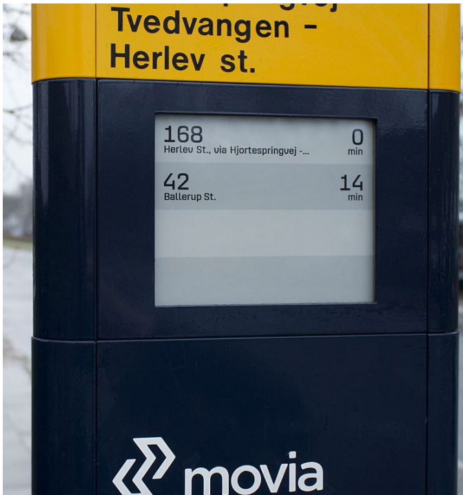
Figur 1: Holscher-stander