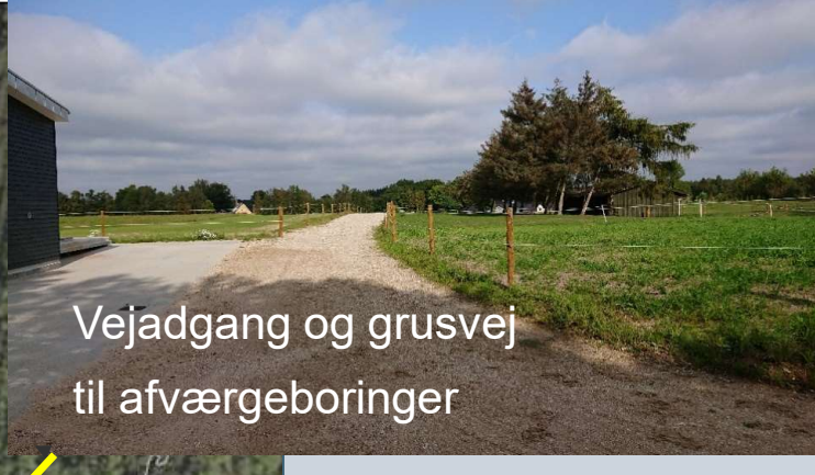
Vejadgang og grusvej til afværgeboringer