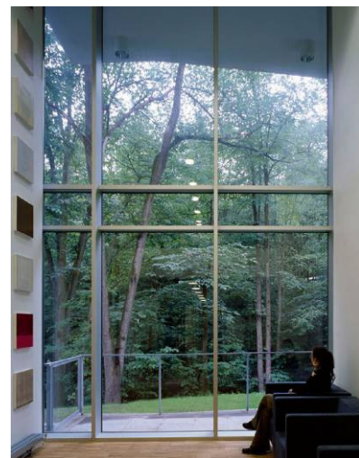
Klinik i Mattersburg - Feyferlik Fritzer Radiumhospitalet, Oslo – Henning Larsen