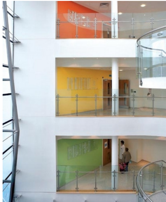
Northern General Hospital, Sheffield - Sheppard Robson