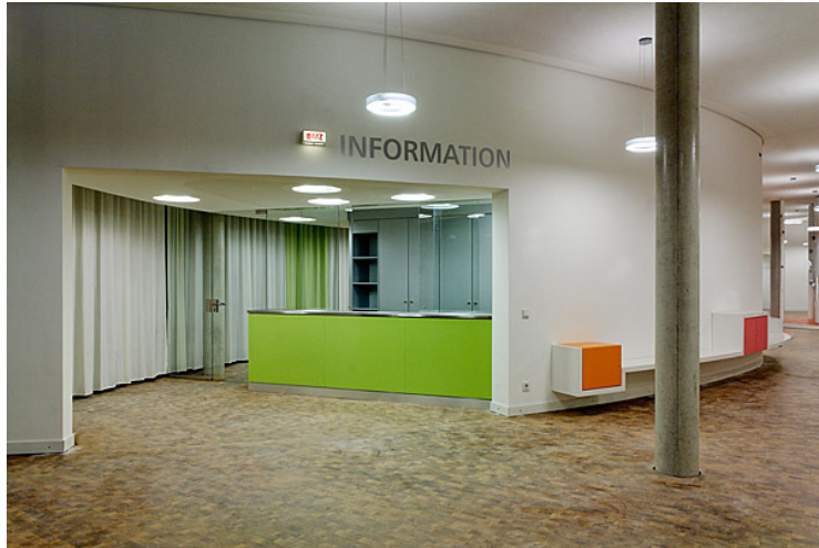
Kinderkliniken Prinzessin Margarete i Darmstadt - Angela Fritsch Architekten

Privathed i modtagelse - fremmede skal ikke kunne overhøre private oplysninger givet ved skranken