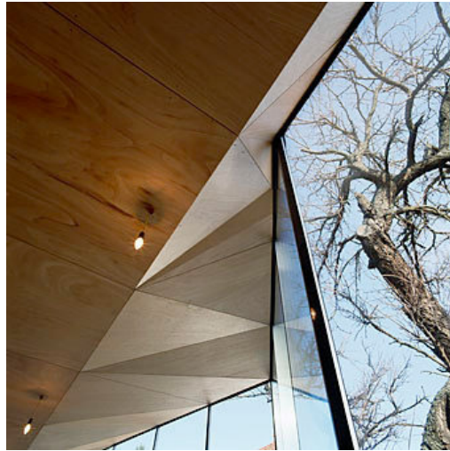
Klinik i Mattersburg af Feyferlik Fritzer

Kunst kan være medvirkende til at skabe rare og trygge rammer for patienter, pårørende og medarbejdere, og skabe positive og stimulerende distraktioner