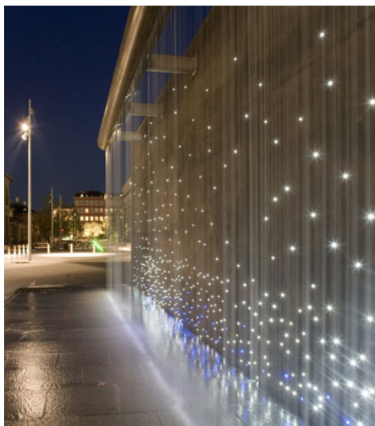
Solbjerg Plads - projekt af SLA

Kunst kan også være en integreret del af uderum f.eks. i form af vandforløb eller udendørs møblering. Kunst og farvesammensætning kan endvidere bruges aktivt til at forbedre den visuelle orientering og gøre det nemmere at finde rundt på hospitalet.