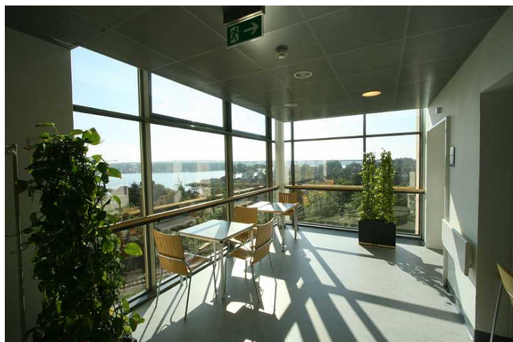
Friis & Moltke - Svendborg Sygehus

Dagslys til sygeplejestationer 12 Dagslys til opholdsrum