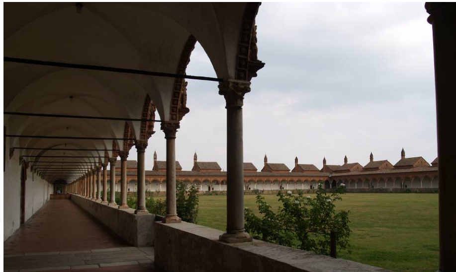
Certosa di Pavia – kloster i Lombardia, Italien

Den grundlæggende tanke er, at den arkitektoniske udformning udtrykt i dagslysets kvalitet, rummets stemning, farver, lyd og muligheden for at være privat og tryk kan understøtte den fysiske og psykiske heling.