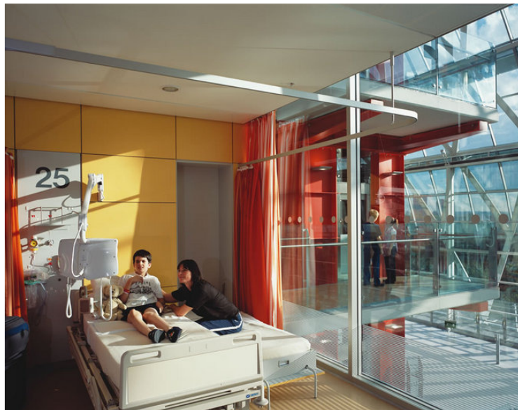
Evelina Children's Hospital - Hopkins Architects

Mulighed for afskærmning på værelset hvis der bruges glasvægge