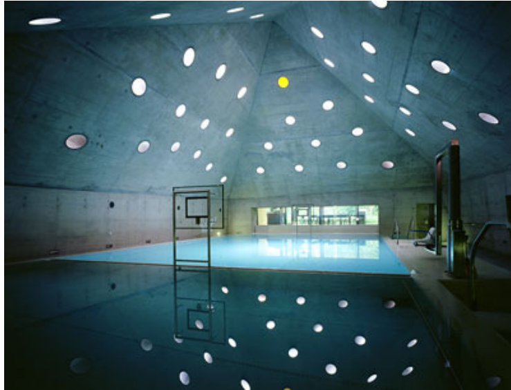
REHAB, Center for Spinal Cord and Brain Injuries – Herzog & de Meuron

Legerum for børn Mulighed for at lytte til musik/naturlyde 16 Udsigt 10 Kunst/farver