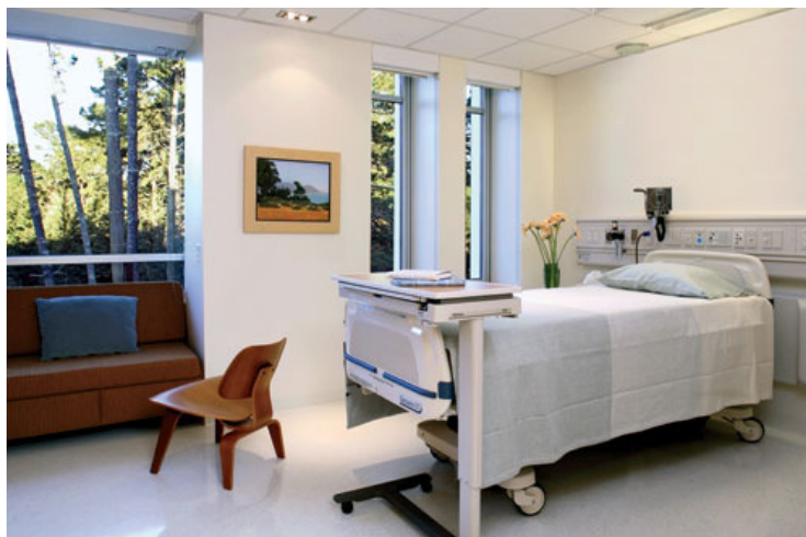
Community Hospital of the Monterey Peninsula – HOK

Plads til familien (også overnattende) på stuerne 37