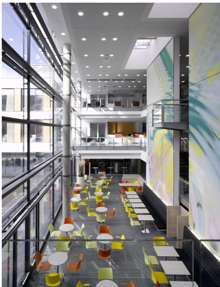
Johannes Weisling Klinikum, Minden - TMK Arkitekter

Aktivitetmuligheder for patienten Adgang til uderum Skyggemuligheder Læ Fællesrum med mulighed for fælles aktiviteter/samtale med andre patienter 9