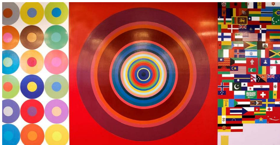
Poul Gernes' kunstværker I foyeren på Herlev Hospital

Det er en fordel at integrere kunsten allerede i begyndelsen af den arkitektoniske planlægning, som man f.eks. gjorde det i planlægningen af Herlev hospital. Her var kunstneren Poul Gernes med allerede fra tilrettelæggelsen af byggeriet, og farverne og kunsten er som en integreret del af arkitekturen blevet en væsentlig del af hospitalets identitet og hjælper way-finding.