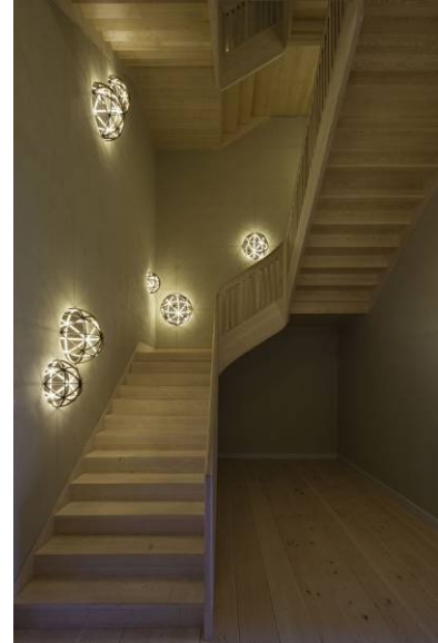
Olafur Eliasson i Christian VIII palæ

I andre projekter ser man kunsten så integreret i byggeriet, at arkitekturen i sig selv bliver et kunstværk.