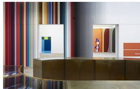
Værker af Malene Landgreen