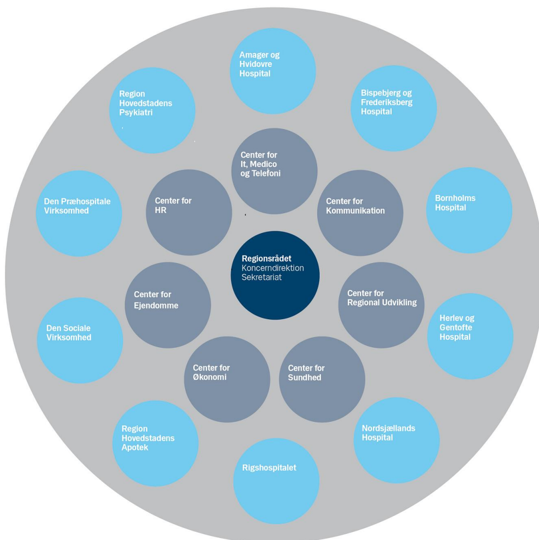
Organisationsdiagram for Region Hovedstaden pr. 31.12.2016

Region Hovedstadens organisation pr. 31.12.2016 ser dermed således ud: