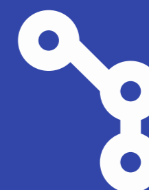
Hurtigt internet, sikker og etisk brug af data