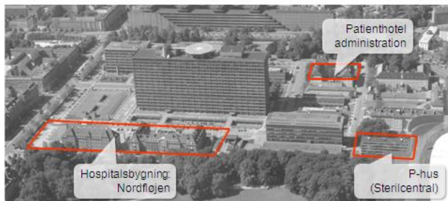
De tre bygninger, tilsammen Det nye Rigshospital udgør første del af en helhedsplan, der forholder sig til hele metrikken