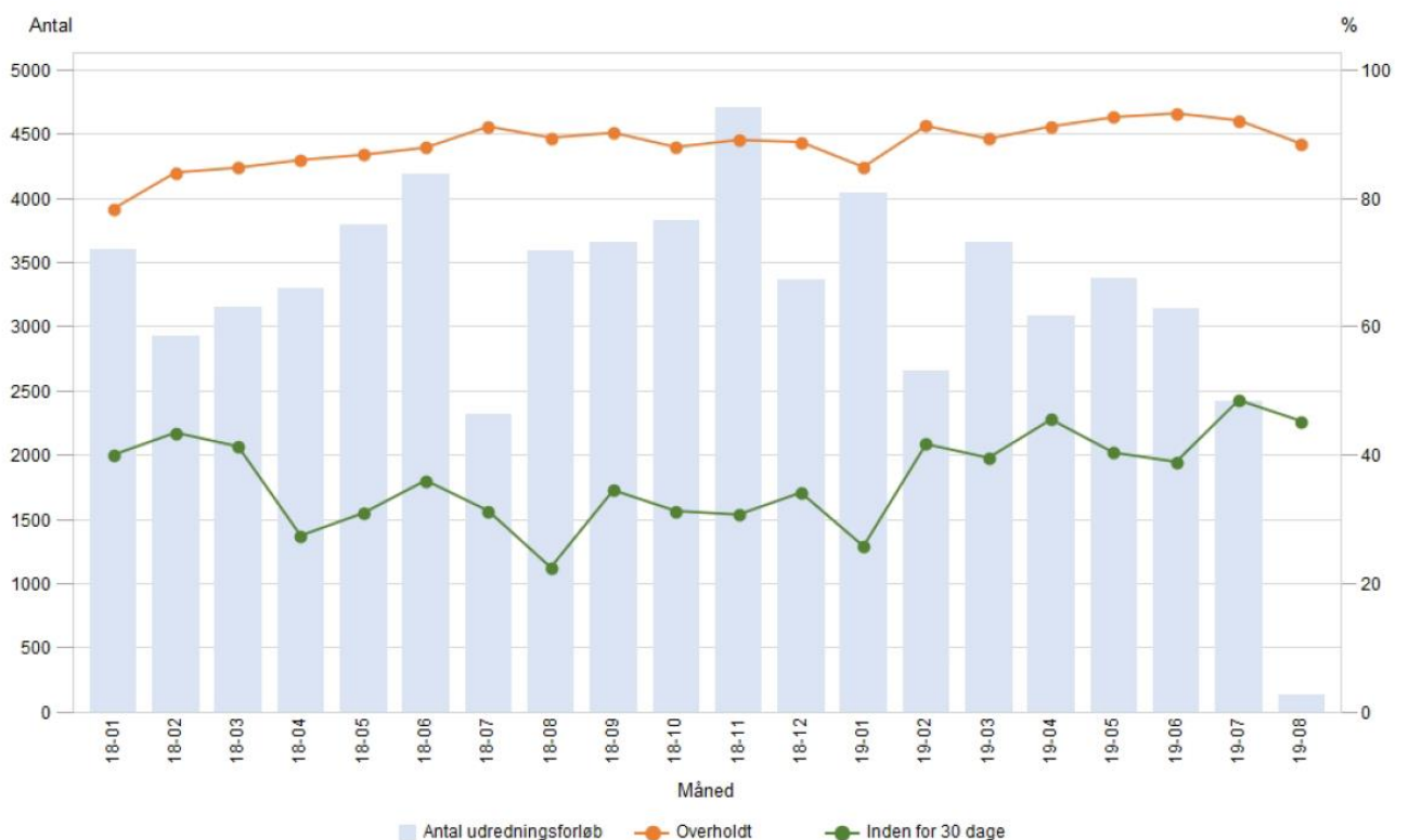
Udvikling i antal registrerede forløb, overholdelse og udredning inden for 30 dage

Figuren nedenfor viser overholdelse af udredningsretten for ortopædkirurgien (data-træk 9. august). Antallet af patienter i august er endnu lavt (blå søjle), og tendensen for overholdelsen i august er derfor endnu usikker.