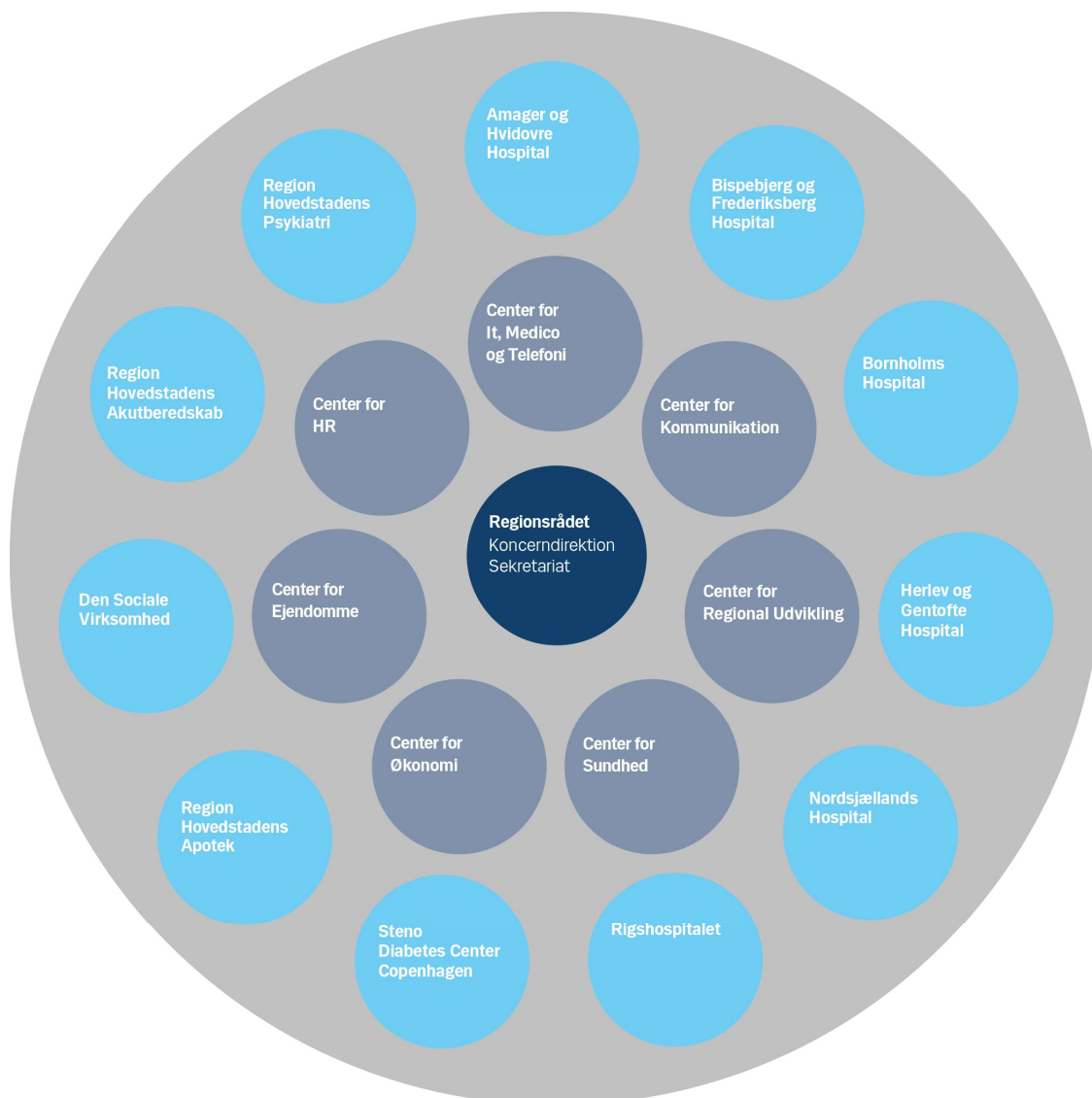
Organisationsdiagram for Region Hovedstaden pr. 31.12.2018

Region Hovedstadens organisation pr. 31. december 2018 ser dermed således ud: