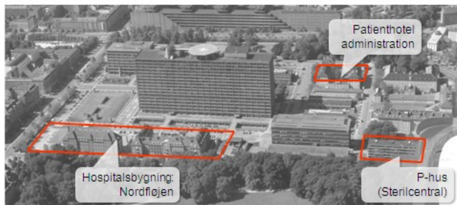
Tre byggerier, tilsammen Det nye Rigshospital udgør første del af en helhedsplan, der forholder sig til hele metrikken