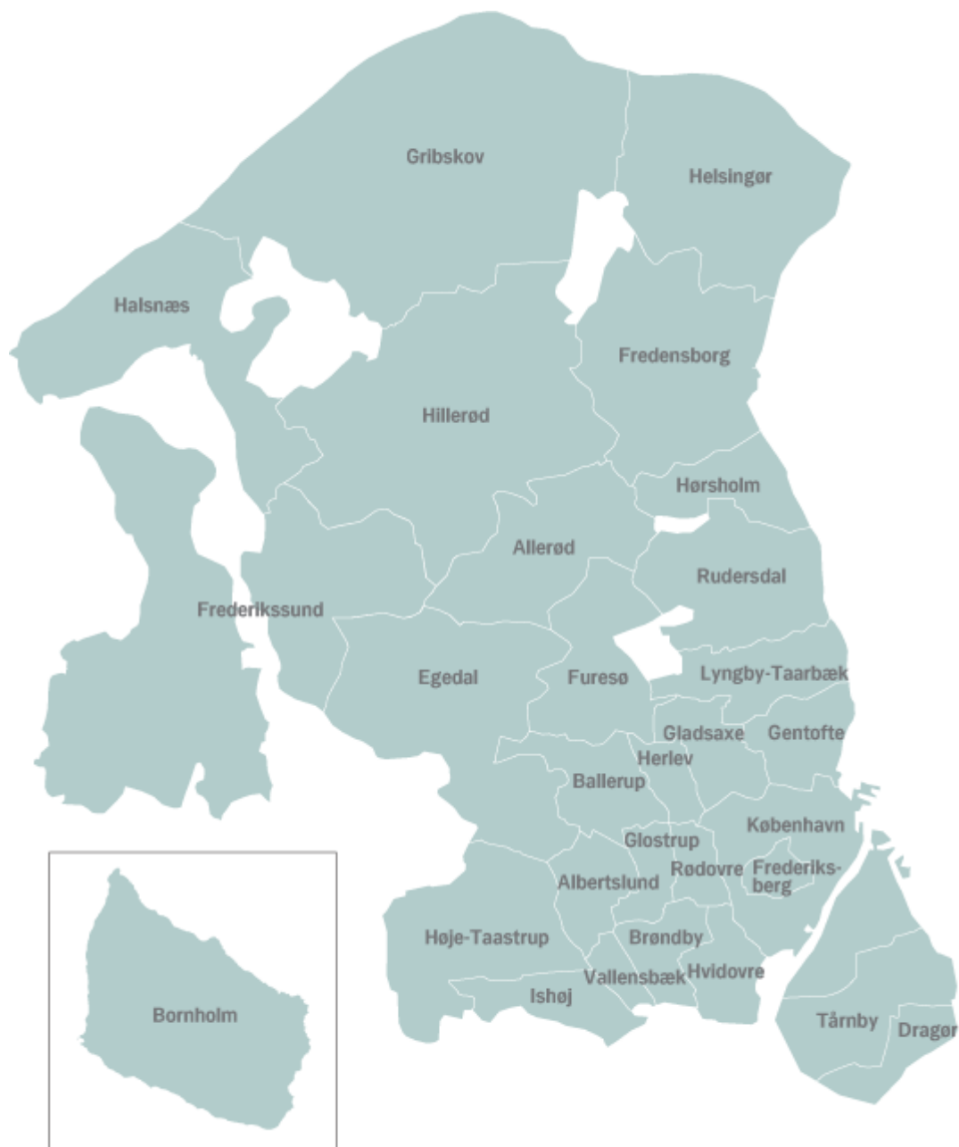
Kort over kommunernes beliggenhed i Region Hovedstaden

Region Hovedstaden er borgermæssigt den største af Danmarks fem regioner, med omkring 1,7 mio. borgere. Regionen omfatter geografisk 28 kommuner samt Bornholms Regionskommune.