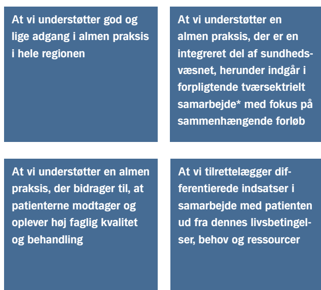
Figur 2: Overordnede målsætninger for Praksisplanen for almen praksis 2015-19

På baggrund af de fire visioner og de nationale krav til praksisplaner for almen praksis udgør nedenstående de overordnede målsætninger for Praksisplanen 2015-19: