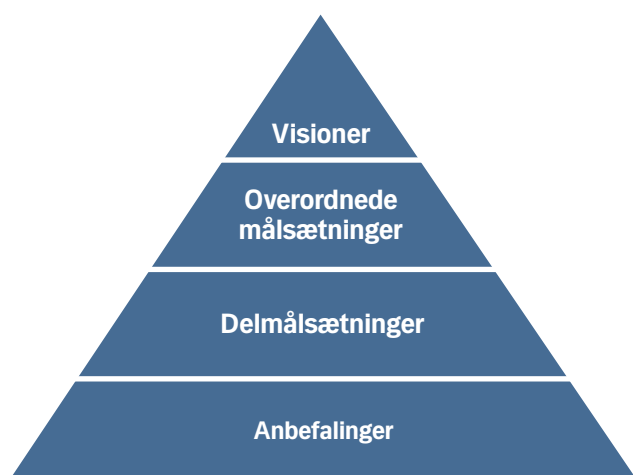
Figur 1: Målhierarki for planlægning og udvikling af almen praksis 2015-2019 i Region Hovedstaden

Med dette udgangspunkt udfoldes de politiske visioner for praksisplanen i et målhierarki, som foruden visionerne omfatter overordnede mål- og delmålsætninger samt anbefalinger for udviklingen i perioden 2015-2019 (figur 1).