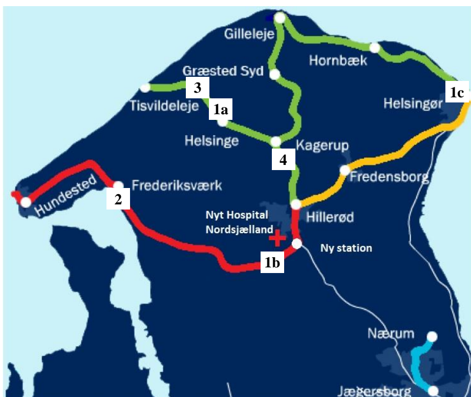
Oversigtskort over Region Hovedstadens lokalbaner i Nordsjælland samt placering af nye projekter.