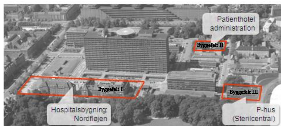
Tre byggerier, tilsammen Det nye Rigshospital udgør første del af en helhedsplan, der forholder sig til hele matriklen

I nærværende afsnit beskrives de enkelte byggeaktiviteter og principper for de økonomiske grænseflader.